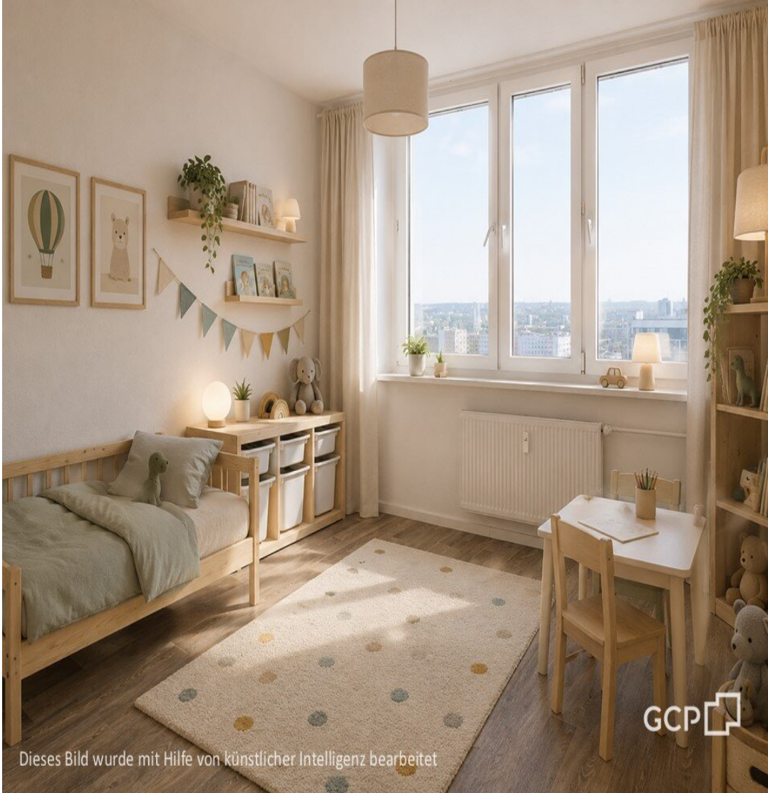
Dieses Bild wurde mit Hilfe von künstlicher Intelligenz bearbeitet