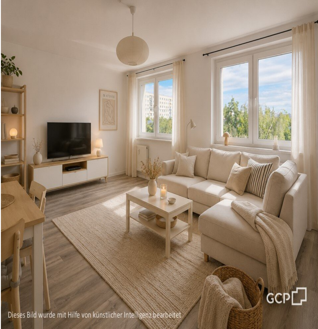
Dieses Bild wurde mit Hilfe von künstlicher Intelligenz bearbeitet