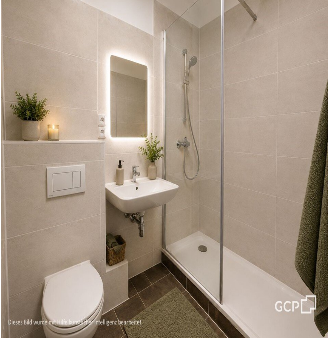
Dieses Bild wurde mit Hilfe künstlicher Intelligenz bearbeitet.