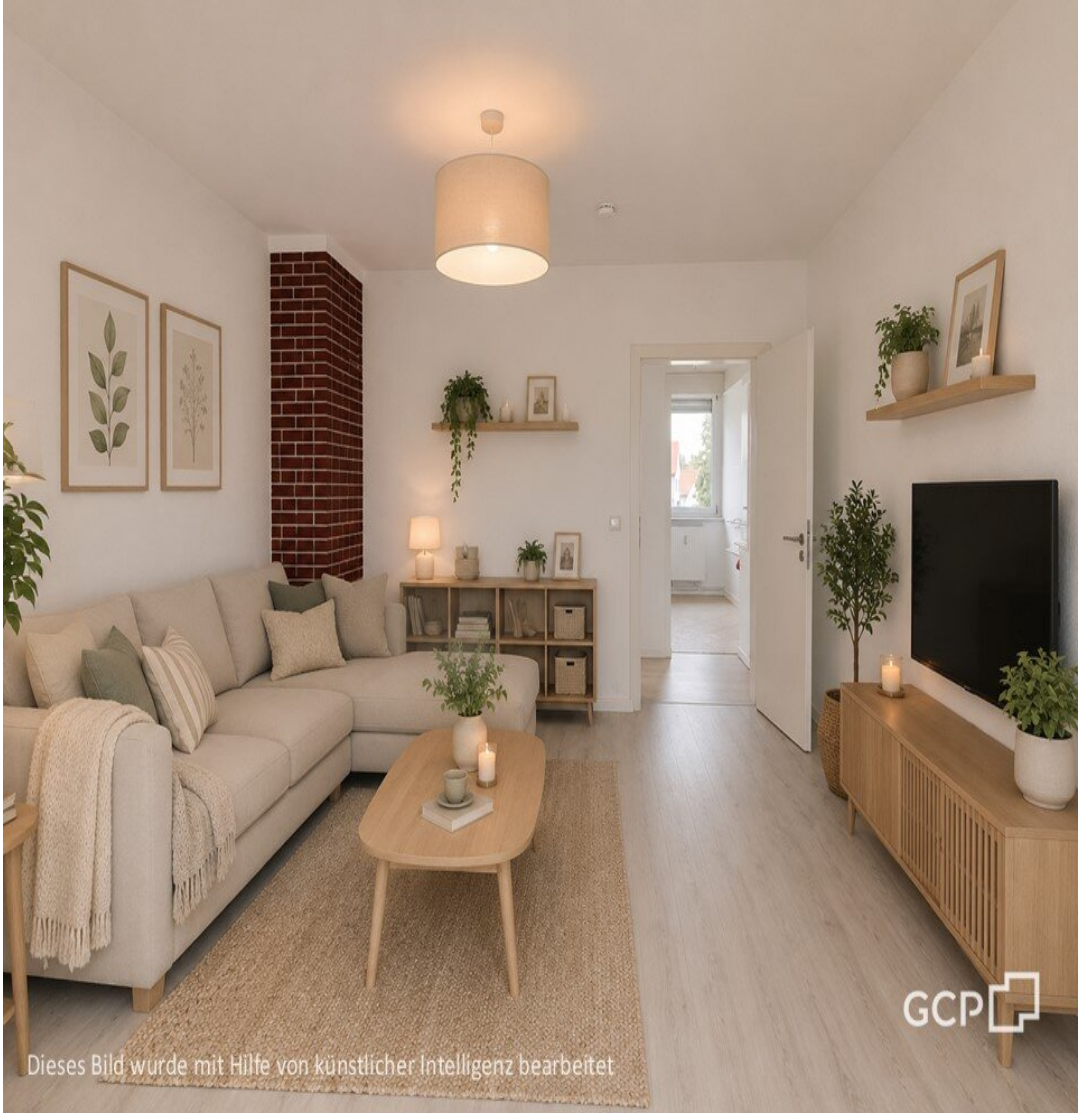
Dieses Bild wurde mit Hilfe von künstlicher Intelligenz bearbeitet